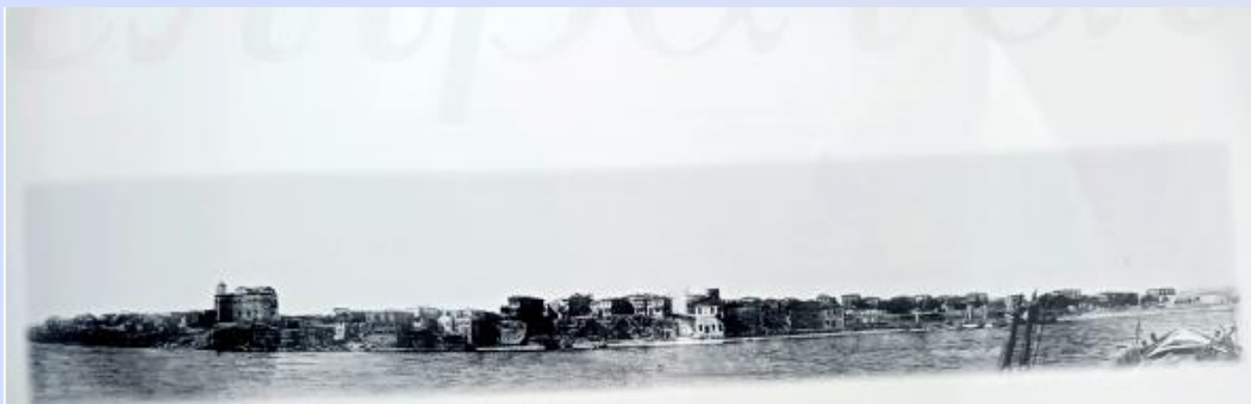
Αποψη των Επιβατών στο τέλος του 18ου αιώνα